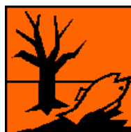
N Produkt niebezpieczny dla środowiska