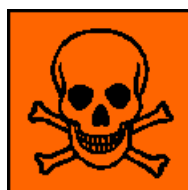
T+ Produkt bardzo toksyczny