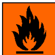
F+ Produkt skrajnie łatwopalny