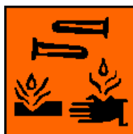
C Produkt żrący