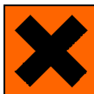
Xn Produkt szkodliwy