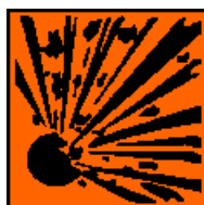
E Produkt wybuchowy