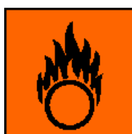
O Produkt utleniający